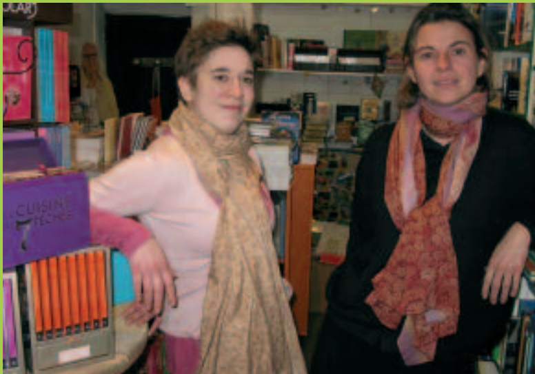
Les libraires de L'Ivre des Mots.

Patronne d'une cafétéria ou libraires : elles ont créé en 2008 à Besançon. Des parcours emblématiques.