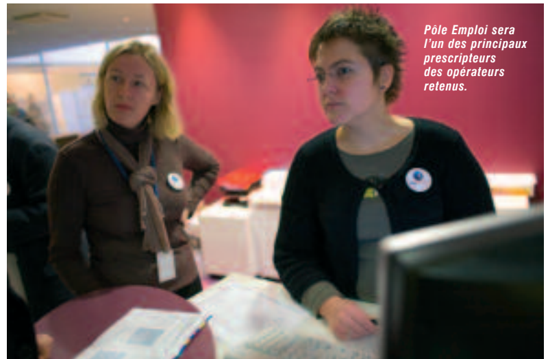
Pôle Emploi sera l'un des principaux prescripteurs des opérateurs retenus.

LA MISE EN PLACE DE NACRE MOBILISE FORTEMENT LES PLATEFORMES.